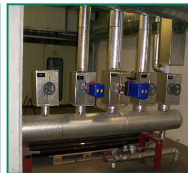
Automatische afsluiters op de stoomleidingen naar de gebruikers