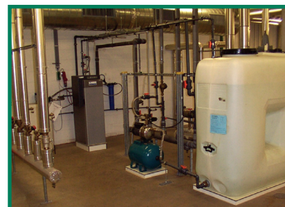
Reversed Osmose installatie

Momenteel is de Clayton stoomgenerator 's nachts op druk. Daar de Clayton stoomgenerator op een wettelijke wijze automatisch kan starten en stoppen, en de unit op een 5tal minuten terug in bedrijf is (door de kleine waterinhoud), zal in de toekomst de Clayton uitgeschakeld worden van 22h30 tot 5h30. Indien gedurende de nacht, één van de kleppen van bevochtigers stoom vraagt, start automatisch de Clayton.