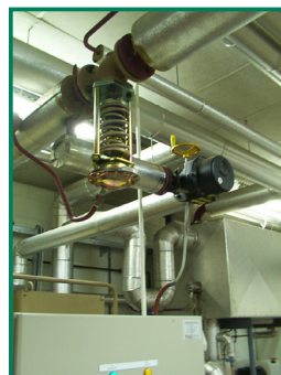
Automatische start/stop afsluiters op de stoomgenerator

De investering bedroeg ongeveer 8000 Euro. De winst op de spuilverliezen, die bij een Clayton stoomgenerator reeds klein zijn, kan de investering niet terugbetalen. Echter rekening houdend met minder problemen in de leidingen, en een lager chemicaliën verbruik, is de investering interessant.