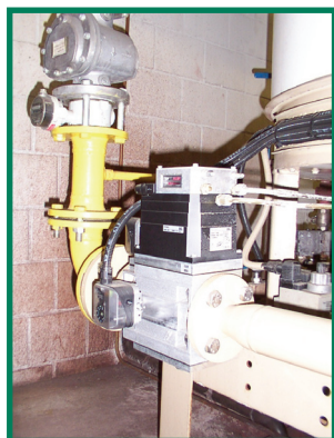
Modulerende aardgastoevoer en frequentieregelaar op de voedingswaterpomp

Rijksweg 30 • 2880 Bornem Tel.: 03 890 57 38 - Fax.: 03 890 57 01 sales@clayton.be www.clayton.be