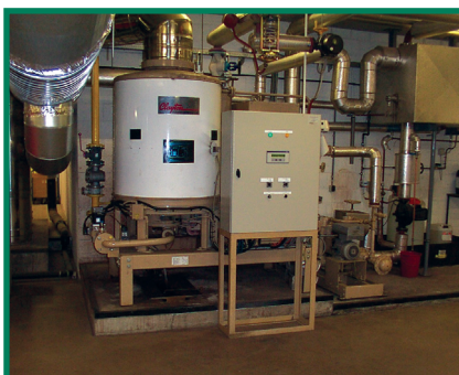
Stoomgenerator KLINA 1200 kg stoom/h

Deze techniek, een standaard op de grotere generatoren, was voor de eerste maal reeds met succes toegepast op een kleinere stoomgenerator bij Heudebert LU (fabrikant van de Grany koekjes).